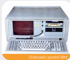
Ordenador portátil IBM

Se crea la Oficina de Servicios Técnicos a la Industria.