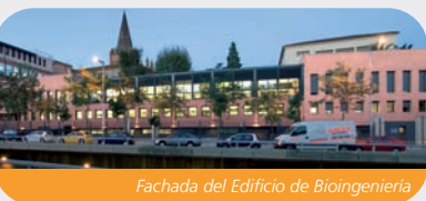
Fachada del Edificio de Bioingeniería