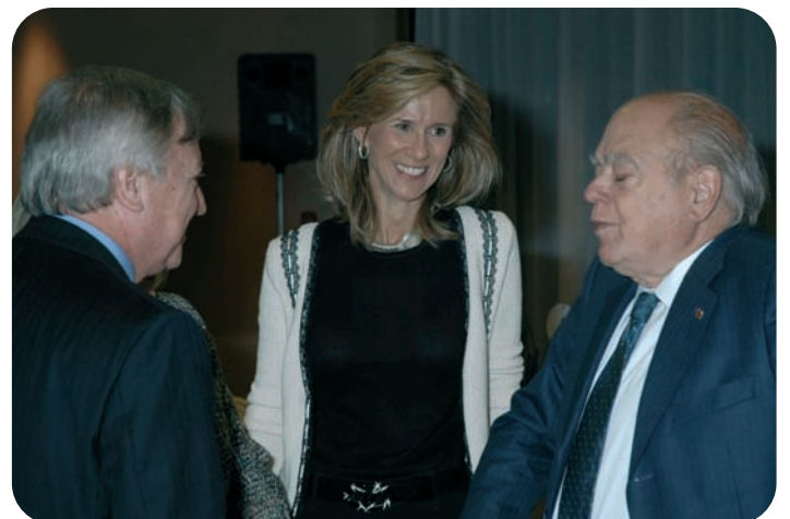
D a Cristina Garmendia Ministra de Ciencia e Innovación

Mi más sincera enhorabuena por el camino recorrido y el brillante futuro que tiene por delante.