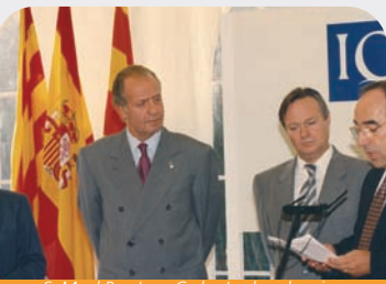
S. M. el Rey Juan Carlos I coloca la primera piedra de las Salas Multimedia

S. M. el Rey Juan Carlos I coloca la primera piedra de las Salas Multimedia; con este motivo visita las instalaciones del IQS.