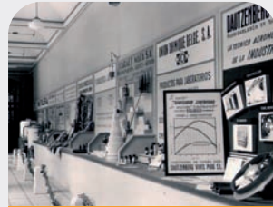
Stands de la Exposición de Productos Químicos y Actividades Industriales

Se celebra un solemne acto de homenaje al P. Vitoria con motivo de cumplir 90 años de edad y 50 años de la fundación del Laboratorio Químico del Ebro; visitan el IQS numerosas personalidades del mundo académico de toda Europa; se organiza una Exposición de Productos Químicos y Actividades Industriales;