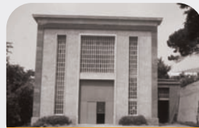
Exterior de la Planta Piloto, recién estrenada